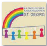
Kindergarten St. Georg in Bulach